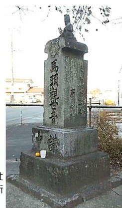
馬頭観世音 (下唐子)

請求記号 H211/イ 『岩鼻遺跡 (第2次)』 東松山市教育委員会 請求記号 H211/カ 『上松本遺跡 (第2次)』 東松山市遺跡調査会 請求記号 H211/ス 『諏訪山古墳群』 東松山市教育委員会 請求記号 H211/ヒ 『東松山市史資料編第1巻考古』 東松山市 請求記号 H211/ヒ 『東松山市史資料編第5巻民俗』 東松山市 請求記号 H211/フ 『古凍 14 号墳 (第1・2次)』 東松山市教育委員会 請求記号 220/シ 『十二支になった動物たちの考古学』 新泉社