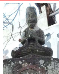
馬頭観世音 馬頭観音坐像 (下唐子)