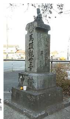
馬頭観世音 (下唐子)

請求記号 H211/イ 『岩鼻遺跡 (第2次)』 東松山市教育委員会 請求記号 H211/カ 『上松本遺跡 (第2次)』 東松山市遺跡調査会 請求記号 H211/ス 『諏訪山古墳群』 東松山市教育委員会 請求記号 H211/ヒ 『東松山市史資料編第1巻考古』 東松山市 請求記号 H211/ヒ 『東松山市史資料編第5巻民俗』 東松山市 請求記号 H211/フ 『古凍 14 号墳 (第1・2次)』 東松山市教育委員会 請求記号 220/シ 『十二支になった動物たちの考古学』 新泉社