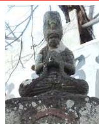
馬頭観世音 馬頭観音坐像 (下唐子)